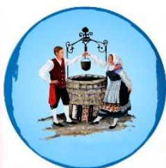
Gruppo Folcloristico "Pasian di Prato"